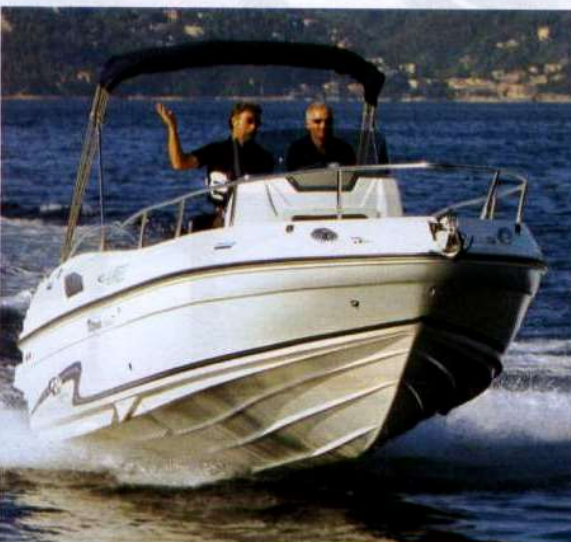
Spinto da un motore entrofuoribordo da 200 cv Nannidiesel, il Vittoria 23.60 supera la velocità di 30 nodi.

Wc marino Impianto doccia Salpancora completo Scafo blu Kit cucina con fornello e lavello Frigorifero Impianto stereo radio e cd Telo copriconsolle Capottina bimini Gancio traino sci