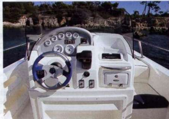
Sopra, la consolle di guida cela un vano dotato di wc marino. A destra, il divanetto per pilota e copilota.