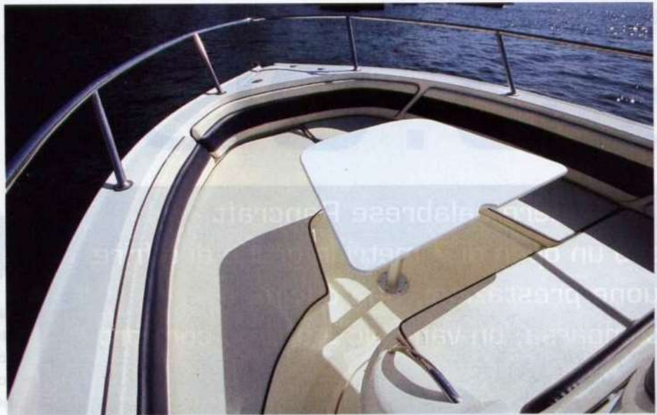
Sopra, la dinette prodiera può essere trasformata in un'ampia superficie prendisole.

La coperta del Vittoria 23.60 si fa apprezzare da poppa fino a prua estrema, per l'attento sfruttamento degli spazi e dei volumi. La spiaggetta poppiera profonda 65 cm si presta con agio alle attività acquatiche e presenta, ricavato nello stampo dello specchio, l'alloggio per due parabordi. Il passaggio al pozzetto avviene direttamente attraverso un "corridoio" tra la murata sinistra e il prendisole. Sotto al suo calpestio è stato ricavato un gavone utile per riporre sia le cime d'ormeggio che pinne, maschere ecc. Appoggiato al prendisole che ricopre il vano motore, troviamo un divanetto a tre posti. Agli ospiti è riservata anche la zona prodiera, che offre una confortevole dinette in grado di accogliere fino a 6-7 persone comodamente sedute. Questa zona, abbassando il tavolino, può essere trasformata in una seconda superficie prendisole di oltre 3 mq. La postazione di guida con consolle centrale mostra, nella parte sinistra, un cruscotto moderno con gli strumenti messi